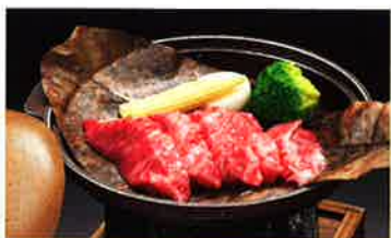
飛騨牛ほうばみそ陶板焼 …3,000円(税込3,150円)