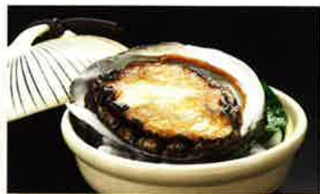
鮎ステーキ…3,000円 (税込3,150円)