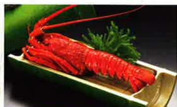
ロブスター姿蒸し…3,000円 (税込3,150円)